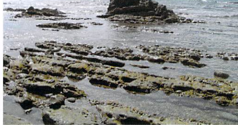
青木繁が滞在した布良の岩礁