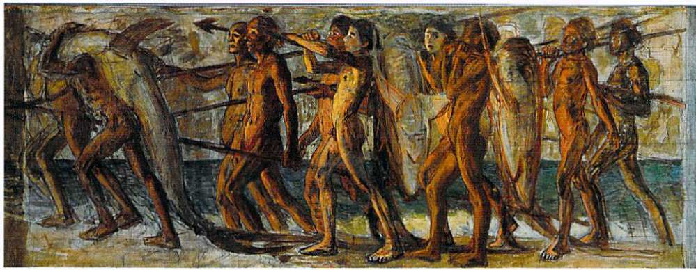
『海の幸』(重要文化財・石橋財団石橋美術館蔵)