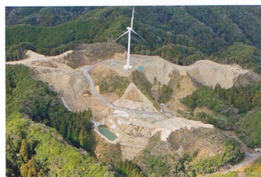
広大な山林が丸裸に。(鴨川市天面)

被害例: 重度の睡眠障害、手足のしびれ、頭部(脳・耳)や胸部(呼吸器)、全身への圧迫感、全身の疲労感、精神の不安定、睡眠時の金縛り・無意識運動