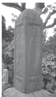
ハングル四面石塔（千葉県指定）文化財

館山の平和学習は、戦争という一面的ではなく、交流・共生という観点から「平和の文化」を多面的に学ぶことができる。