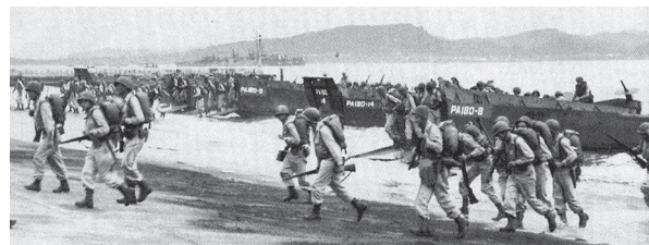
1945. 9. 3米占領軍の館山上陸

赤山地下壕内には「USA」の朱文字が残されている。近年、米国テキサス軍事博物館から入手した資料のなかに、館山に上陸した米占領軍司令官の報告書があった。そこには、「完全な地下海軍航空司令所が館山海軍航空基地で発見され、そこには完全な信号、電源、ほかの様々な装備が含まれていた」と記され、赤山地下壕が完備な状態で存在していたことがわかる。単なる防空壕ではなく、館山海軍航空隊の管制機能をもつ航空要塞的な地下施設であったことが示唆される。