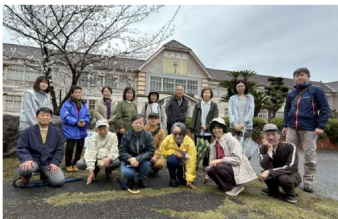
木造校舎を愛する会 運営委員ら 2026.4.4

千葉県立安房南高校旧第一校舎は、1930（昭和5）年に安房高等女学校として建てられ、まもなく100年を迎えます。関東大震災の教訓を得て、女学校にふさわしい装飾を備えた美しい校舎です。コンクリートの建て替えが進んだ1970年代に管理棟のみ保存され、後に県指定文化財となりました。しかし安房高校との統合により使われなくなって18年。私たちはよりよい保存活用を目指して、「安房高等女学校木造校舎を愛する会」を発足し、草刈りなどの環境整備とともに、歴史調査を進めてきました。