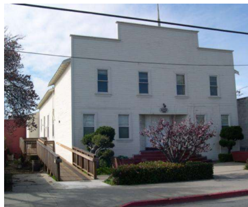
In 1926, the Nihonjinkai (Japanese Association) organized and funded the land purchase and construction of the hall.