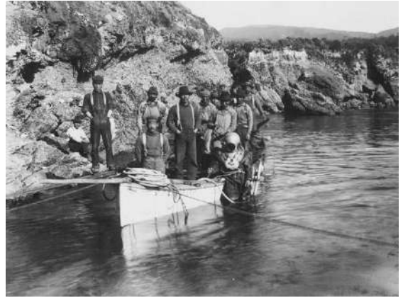
アワバイダイバー 安田正行氏所蔵