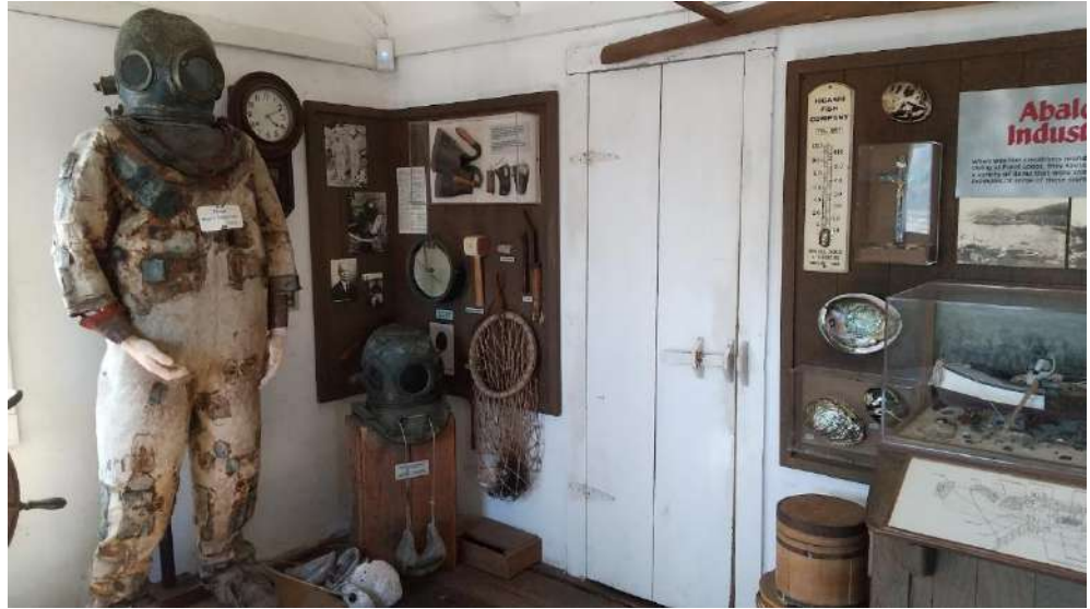
ポイントロボスのホエーラーズ・キャビン・ミュージアムの展示