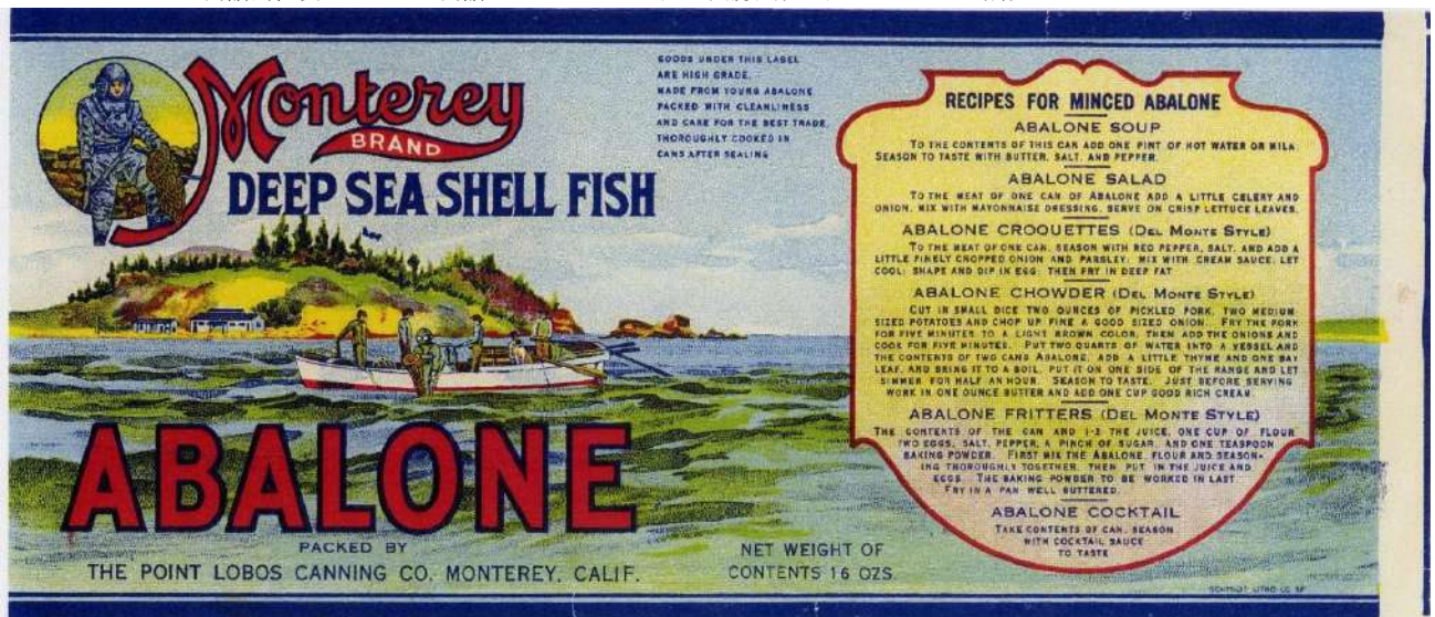
ラベルに印刷されたレシピは、サティ・アーレンの考案といわれる