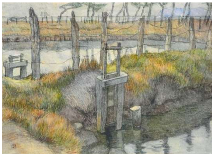
《水門》 倉田白羊 館山市図書館所蔵