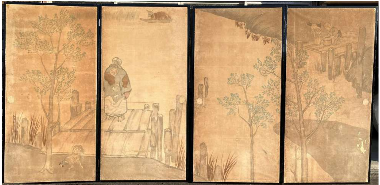
小谷仲治郎の義弟・倉田白羊が描いたふすま絵 NPO 法人安房文化遺産フォーラム所蔵