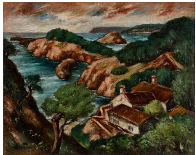
図6：ヘンリー杉本《カーメルハイランド海辺》1937年、和歌山県立近代美術館

本（1900-1990）もモントレイを訪れた一人である。杉本がアメリカに渡ったのは1919年であり、はじめは高校に通い、1920年代半ばにはサンフランシスコで美術を学んでいるものの1929年からパリに留学していたこともあり、小圃や上山とは一世代分、活動時期がずれている。