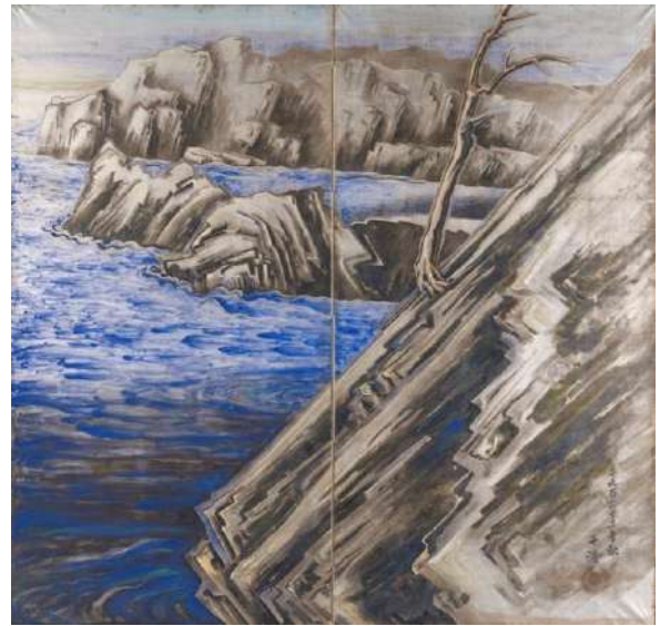
図4：小圃千浦《ポイントロボス、モントレイ、カリフォルニア》（原題：月光）1922年、スミソニアン・アメリカ美術館（Gift of the Estate of Chiura Obata, 2020.72.1. ）

小圃は、1927年に出かけたヨセミテ溪谷への制作旅行を機に、明確にカリフォルニアの大自然を描く自覚とともに、日本画家としての名声とカリフォルニア大学での教員の立場も得ることになる。しかしそれに先立つ1920年代初頭には、モントレイの北、サンタクルーズ山脈