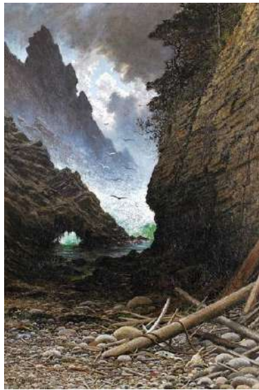
図3：ジュール・タヴェルニエ《ポイントロボス、モントレイ、カリフォルニア》1877年、ミルズ大学美術館

最初の「開拓者」は太平洋ではなく、大西洋を越えて東からやって来た。フランス系アメリカ人で、バルビゾンでも描いたジュール・タヴェルニエ（1844-1889）である。彼は『ハーバーズ・ウィークリー』誌の取材として、ニューヨークから西へと移動し、先住民族の様子やアメリカの大自然を描いた。サン