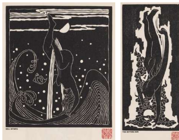
(左) 図8：彦山禎吉《海のニンフ》、(右) 図9：《日没》 ともに木版画集『黒炎』1923年より

さらに上山のイメージを冒頭で紹介したタヴェルニエのグラフィックの仕事【図10】と見比べてみれ