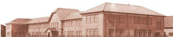
安房南高校 旧第一校舎 (千葉県指定有形文化財)

*会員特典として、10/20(火)に映画『赤い鯨と白い蛇』鑑賞を企画しました。詳細は中面(P3)参照。