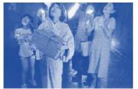
館山の戦争遺跡群