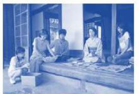
古民家(茨城県阿見町)/離れ(館山)