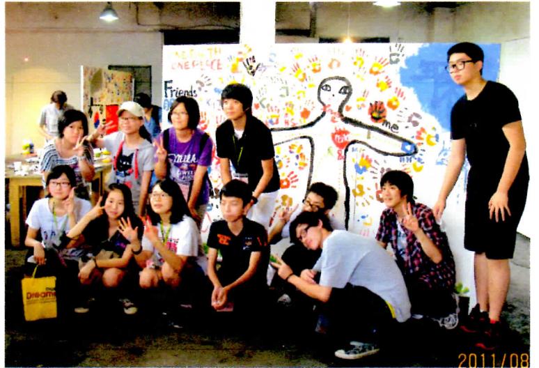
昨年の仁川（韓国）で共同制作をした壁画

「日中韓青少年歴史体験キャンプ」は、今夏で第11回目となります。これまでにおよそ1000人の3国青少年が、5泊6日間、現地のフィールドワークや証言、講演を通じて学び、討論・対話によって深め合い、歴史認識の共有をめざしてきました。通訳の担当者がたくさんいますから安心です。文化交流やスポーツ大会もあってすごく盛り上がります。なによりも隣国にたいする誤解や偏見から解放され、平和を願う国際交流によって多くの友人を得ることができます。21世紀の東アジアに暮らす私たちの平和や安定をどのようにして創るのか、過去の侵略戦争の和解をどのように考えるのか。この青少年キャンプはあなた自身の将来や生き方に大きな影響を与えるでしょう。あなたも参加してみませんか。