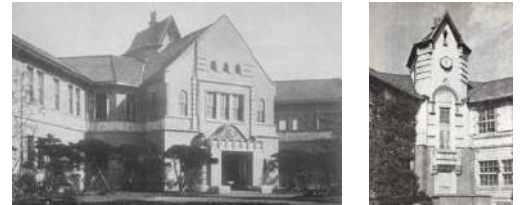
「県立千葉中学校新築落成記念帖」より