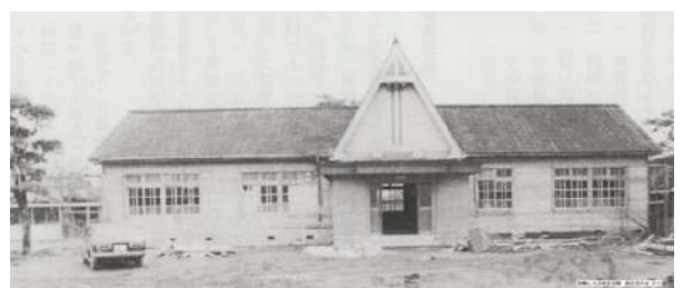
移動した旧校舎玄関「創立百年史」より