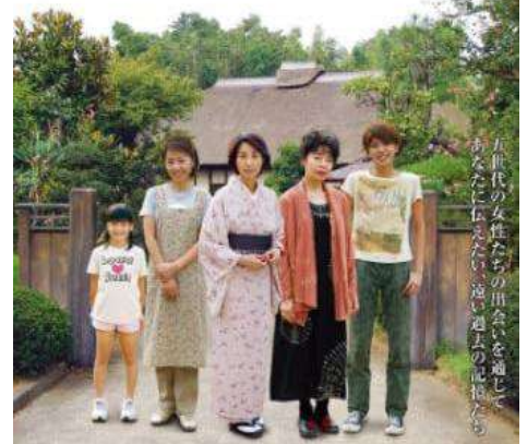
坂野真理 浅田美代子 香川京子 樹木希林 宮地真緒