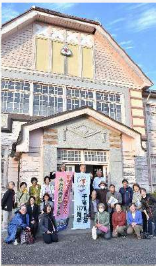
旧県立安房南高校の第一校舎と、「安房高等女学校木造校舎を愛する会」のメンバー＝館山市北条

県指定有形文化財の旧県立安房南高校（館山市北条）の第一校舎を補修など適切に保存して活用し、国指定文化財へ格上げしてほしいと、NPO 法人安房文化遺産フォーラムと「安房高等女学校木造校舎を愛する会」が 6 日、1 万人を事務局として 2017 年に発足。敷地の草刈りや校舎の清掃、また調査、記録などの