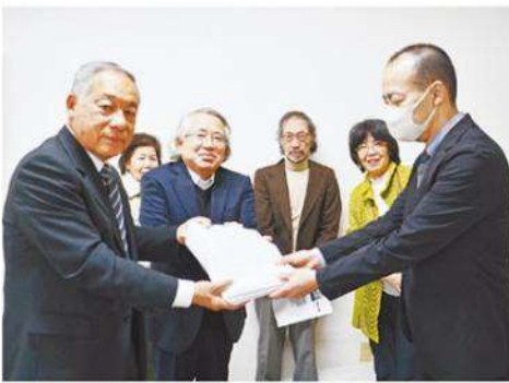
要望書と署名を県職員に手渡す関係者ら＝館山